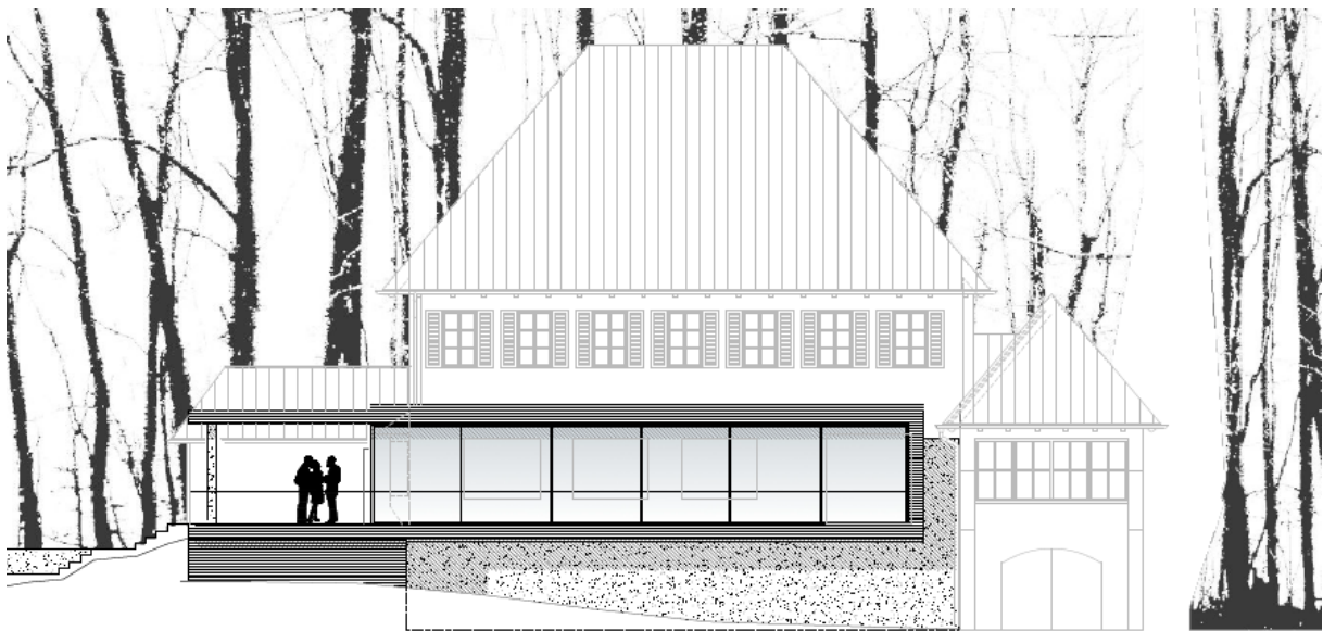
ANSICHT VON SÜDOSTEN

Einstimmig billigte der Ausschuss das Vorhaben der Schlösser- und Seenverwaltung, an der östlichen, seeseitigen Seite der Gaststätte „Alte Villa“ statt der vorhandenen Folieneinhausung einen Wintergarten mit fester Bedachung zu errichten, welcher eine ganzjährige Nutzung ermöglichen soll. Der Neubau des Wintergartens als beheizter Innenraum, durch 2-seitige Verglasung zum See geöffnet, soll eine Verbindung von Innen- und Außenbereich zulassen. Die Fortsetzung des Flachdaches bildet den Abschluss mit einem überdachten Terrassenbereich im Süden. Der Ausschuss knüpfte seine Zustimmung an den Vorbehalt, dass keine verspiegelten Gläser verwendet werden.