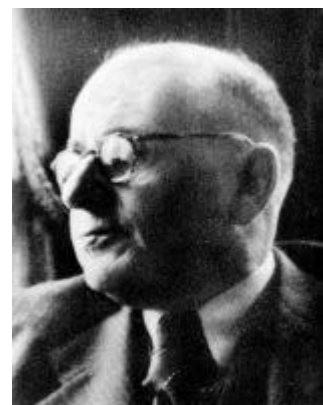
Abbildung: Benno Arnold; Quelle: https://gedenkbuch-augsburg.de/biography/benno-arnold/ , 30.07.20