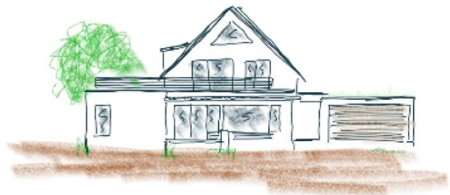
Abbildung 4 Skizze Lisa Vogt

Über das Neubau-Projekt wurde zuletzt im alten Gemeinderat beraten und das Einvernehmen nicht erteilt. Der angepasste Antrag wurde insbesondere hinsichtlich seiner Befreiungen positiv beschieden. Einzig die Befreiung auf graue Dachziegelfarbe wurde auf Antrag separat abgestimmt und entsprechend der letzten Abstimmung im gleichen Bebauungsplan Wittelsbacher Hof mit 4:12 Stimmen abgelehnt.