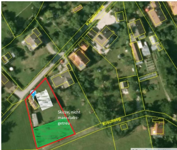
Abbildung 1

Im Flächennutzungsplan wurde das betroffene Grundstück als Wohngebiet ausgewiesen, mit der Absicht hier ortsabrundendes Bauen zuzulassen.