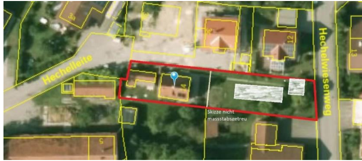
Abbildung 2 Quelle Bayernatlas: https://geoportal.bayern.de/bayernatlas , 30.07.20

Das zur Bebauung vorgesehene Grundstück beinhaltet bereits ein Gebäude und soll geteilt werden so dass ein neues Grundstück mit circa 425 m 2 entsteht. Das Gebäude ist somit nur in sehr schmaler Bauweise ausführbar. Es unterliegt keinem Bebauungsplan.